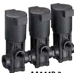
AA144P-3 (három egység)