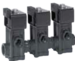
AA144A-3 (három egység)