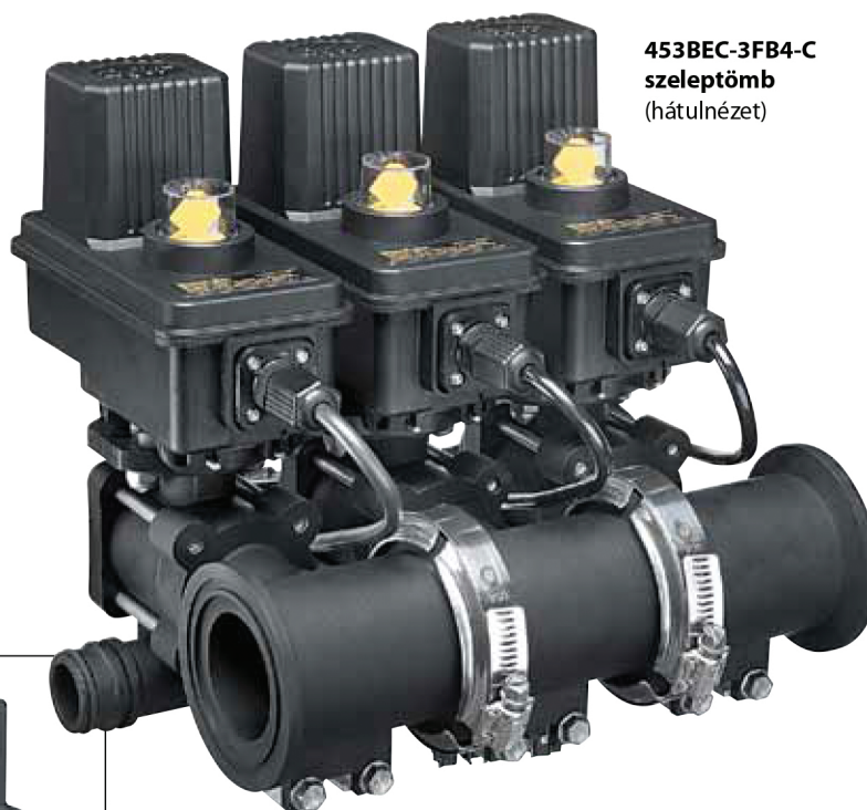
453BEC-3FB4-C szeleptömb (hátnézet)