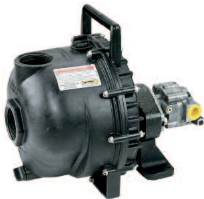
Műanyag házas 300 PHY töltőszivattyú

mobil vagy helyhez kötött berendezésekhez, opcionálisan műanyag raklapra előszerelve