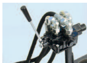
Vezérlő- és szabályzó szelep