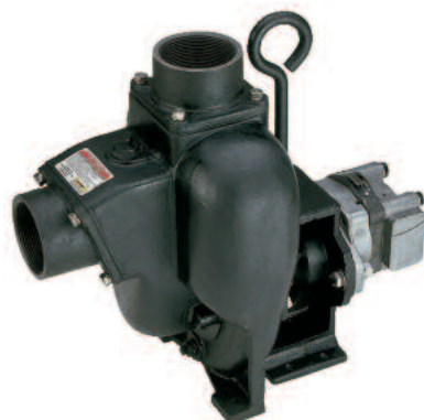
Öntöttvas-házas 300 PIHY töltőszivattyú