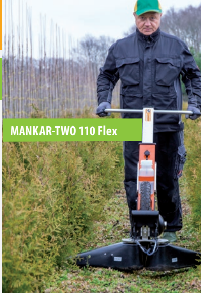
MANKAR-TWO 110 Flex

Elektronikus fúvóka- és akkumulátor ellenőrző LED-fénnyel jelez, ha üzemzavar áll elő. A szeráfolyása jól láthatóan nyomon követhető.