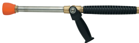
22.1617.11 22.1617.73 sotto insieme lavaggio washing subassembly