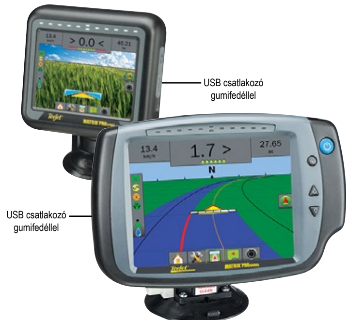
MATRIX PRO 840GS

Ha kérdése van vagy segítségre van szüksége lépjen kapcsolatba a TeeJet Technologies vállalattal.