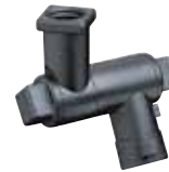
QJ8600-1/4-NYB Szimpla elfogatható szórófej