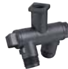
8600-2 típus – nejlon Dupla elfogatható szórófej