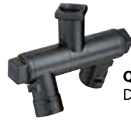
QJ8600-2-1/4-NYB Dupla elfogatható szórófej

A QJ8600 elfogatható Quick TeeJet szórófejtest szerelvények biztosítják a szabvány TeeJet menetes elfogatható testek fűvókájának állíthatóságát, kiegészítve a Quick TeeJet rendszer gyorsan cserélhető és önbeálló jellemzőivel.