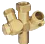
5932 típus Dupla elfogatható szórófej 1/4" belső amerikai csőmenetes fenék kiömlővel