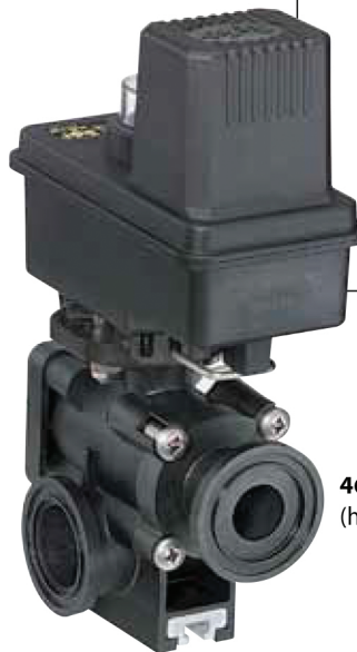
461BEC-2F-C szelep (hátnézet)