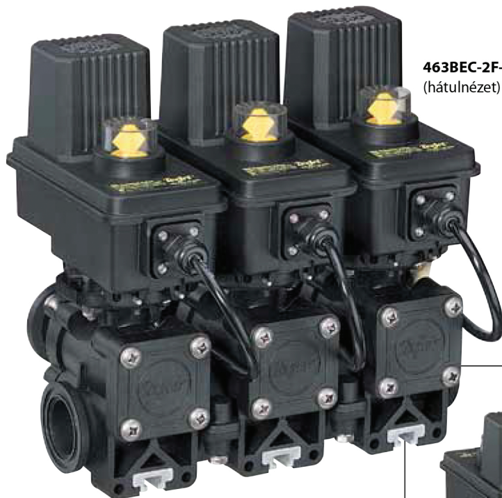
463BEC-2F-C szeleptömb (hátnézet)